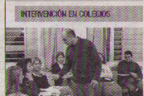
INTERVENCIÓN EN COLEGIOS

El sexólogo elogió el programa Educación sexual con arte que desde hace cinco años se